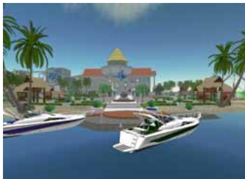
ウェブスター島イメージ画像

新サービス開始にあたり、ウェブスタージャパン自身の「ショールーム」の役割として、「Second Life」内にウェブスター島(webstar 128,128,0)を建設しました。ウェブスター島は、タイをモチーフにしたリゾート島で、ホテル、プール、ビーチ、滝、ダンスクラブ、バー、ウォータースライダー等を併設しています。