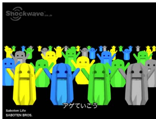
サボテン Bros. ミュージッククリップ 2