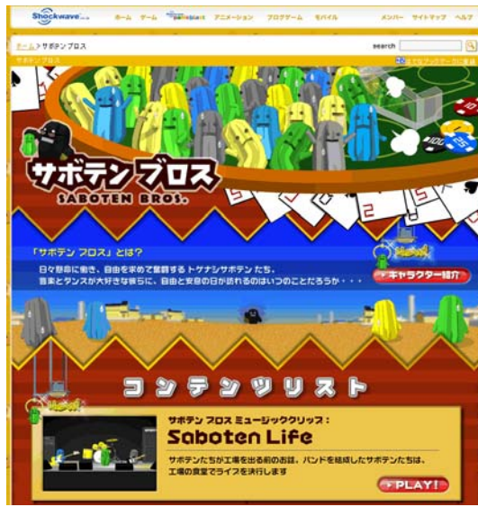
サボテン Bros. スペシャルサイト