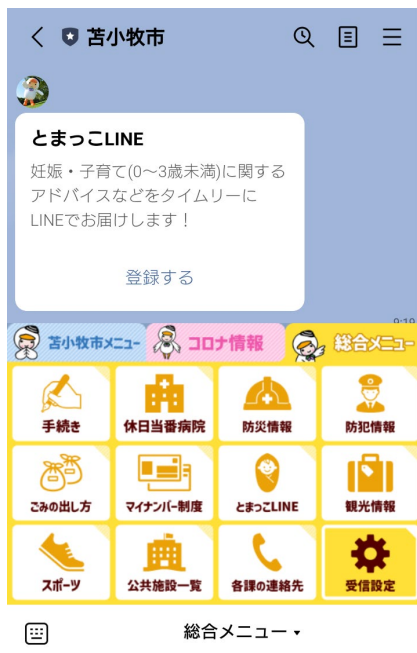
苫小牧市 LINE 公式アカウントのリッチメニュー