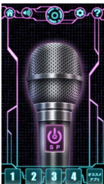
▲Air Beat Box プレイ画面

スマートフォンをマイクのように握り、録音(プリセット)されている Daichi のビートにあわせて口を動かすだけで、パフォーマンスが完成します。もちろん Daichi のビートにユーザーの声を重ね、Daichi とのセッションパフォーマンスを行うことも可能です。まるでそこに Daichi がいるかのようにカラオケやパーティなどでヒューマンビートボックスを楽しむことができます。