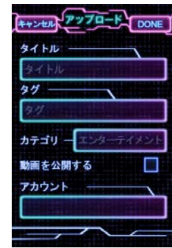
▲YouTube アップロード画面