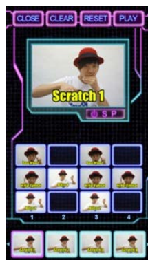
▲プリセット音源設定画面