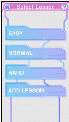
レッスン選択画面