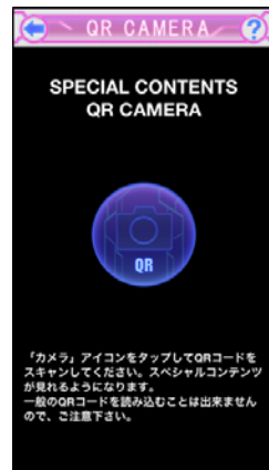
SPECIAL コードキャプチャ画面