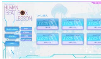
-レッスン購入画面-