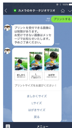
トーク画面でプリントしたい 画像を送りサイズを選択