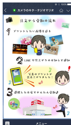
プリント注文の流れを トーク画面上でご案内