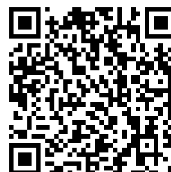
「SNS カウンセリング～ココロの健康相談」 LINE アカウント QR コード