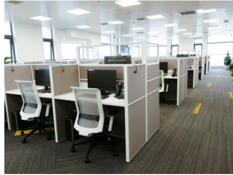
オペレーションエリア