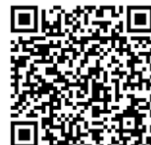
京都市 LINE@アカウント QR コード