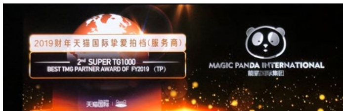
<Magic Panda 受賞発表>