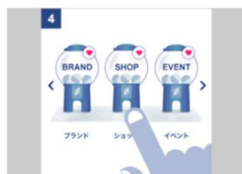
「ANA スカイ ガッチャ!モール」内の気になるお店を選んでガッチャを回す