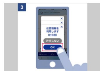
端末の位置情報をON（端末およびアプリ）にし、位置情報を許可する