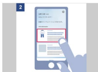
インフォメーション画面内の「ANA スカイ ガッチャ!モール」の記事をタップ