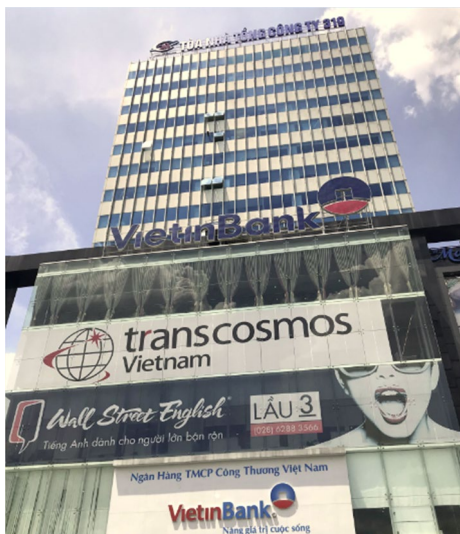
＜「ホーチミン第三センター」を開設する Pico Plaza 外観＞

新しい商業ビル内に「ホーチミン第三センター」を新設、既存の「ハノイセンター」を拡張し、ベトナム国内 1,750 席にトランスコスモス株式会社(本社:東京都渋谷区、代表取締役社長兼 COO:奥田昌孝)は、ベトナム ホーチミンに新たなオペレーション拠点「ホーチミン第三センター」を設立、また、既存の「ハノイセンター」を拡張しました。ベトナム全域では 5 拠点、1,750 席の規模となります。