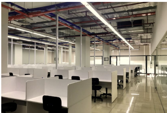
＜オペレーションブース＞