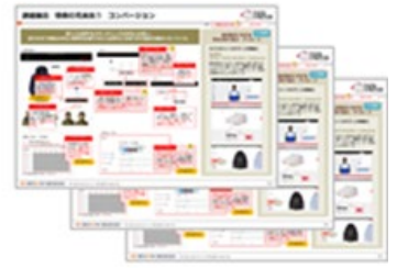
改善施策サービス資料

※トランスコスモスは、トランスコスモス株式会社の日本及びその他の国における登録商標または商標です