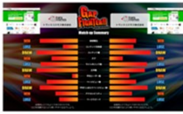
マッチアップサマリ