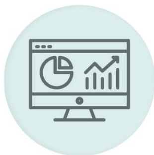
コンテンツ状況の現状分析 SEO観点の分析