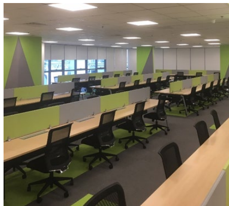
<オペレーションルーム>