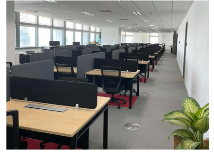
<オペレーションエリア>

トランスコスモスマレーシアは 2014 年に設立し、2015 年にはマレーシア大手の EC モール運営企業である INTERBASE RESOURCES SDN.BHD 資本・業務提携、2016 年にコンタクトセンター、デジタルマーケティングサービス、EC ワンストップサービスの開始、2017 年にはフィンテック企業である Soft Space Sdn Bhd との資本・業務提携、2019 年には認可取得を必要としない越境 EC、免税(インフライト)および卸販売を開始し、また 2021 年より IT アウトソーシングサービスを開始するなど、一貫してデジタルトランスフォーメーションを軸に推進、事業を拡大してきました。また、今回の第三拠点の新設により、従業員数は現在の 700 名体制から 2021 年中には約 1,000 名体制まで増加する見込みです。