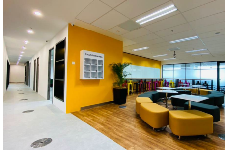
<リフレッシュルーム>