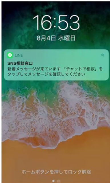
スマートフォンにLINEアプリのプッシュ通知が表示