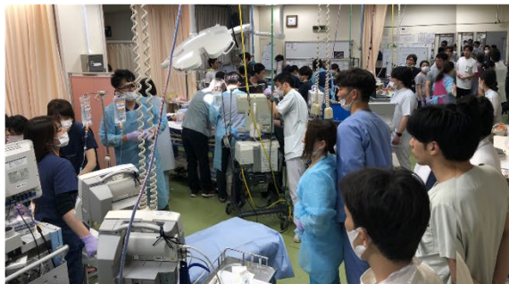
4人の患者に対し50人以上のスタッフがいたが、情報共有は困難を極めた