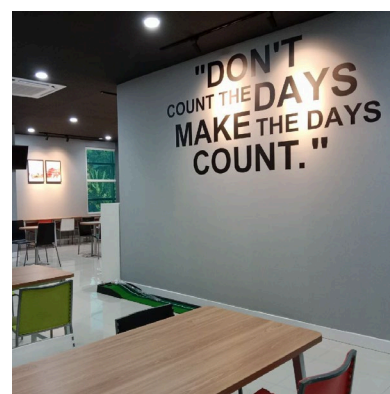
写真:スマラン第二センター

Trust & Safety サービスとは、不特定多数のユーザーによって投稿されたインターネット上のコンテンツ(書き込み・画像・動画)を監視するモニタリング業務(投稿監視)のことです。オンラインコンテンツを監視しリスクを軽減することは、コンテンツの整合性と安全性を確保するうえで非常に重要です。トランスコスモスの専門チームが有人による監視を行うことで、お客様企業のコンテンツをより健全・良好な状態に保ち、企業とユーザーの双方を保護します。