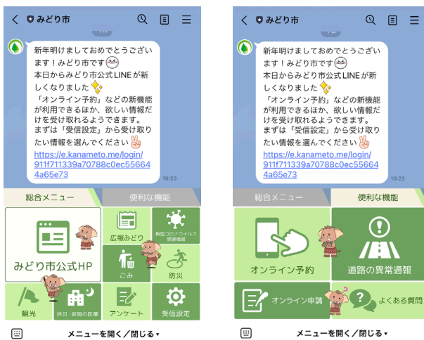
みどり市 LINE 公式アカウントのリッチメニュー