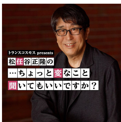
パーソナリティ 松任谷正隆氏

トランスコスモス株式会社(代表取締役共同社長: 牟田正明、神谷健志)は、TOKYO FM とのコラボレーションで、メタバース空間で聴覚・視覚・嗅覚まで楽しむ番組を公開収録。その模様は音楽プロデューサー・松任谷正隆が、毎週、様々な分野のゲストを迎えて新たな魅力に迫る『松任谷正隆の…ちょっと変なこと聞いてもいいですか?』で8月25日(金)9月1日(金)午後5時30分から放送します。