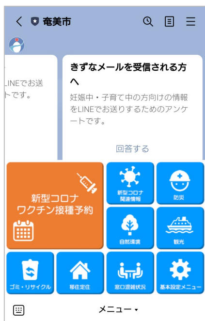
奄美市 LINE 公式アカウント リッチメニュー