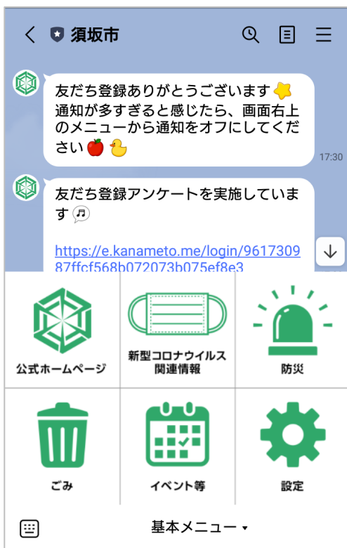
須坂市 LINE 公式アカウントのリッチメニュー