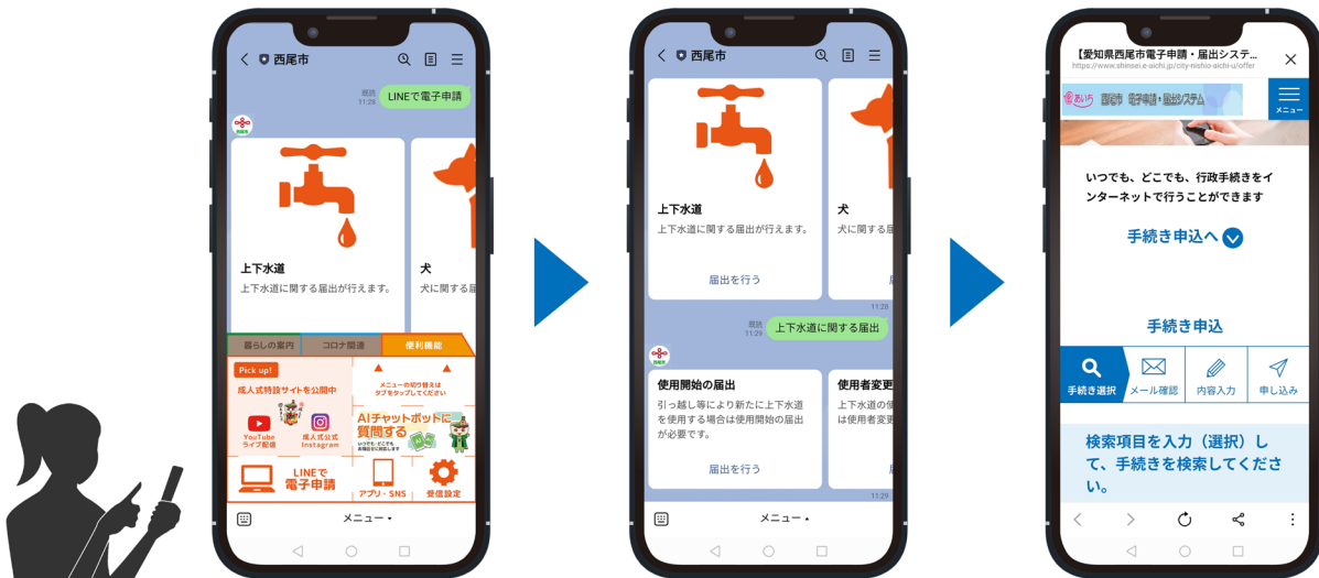
LINE 経由のオンライン申請イメージ

愛知県西尾市(以下、西尾市)は、2022 年 2 月 1 日より、株式会社NTTデータ関西(以下、NTTデータ関西)が提供する「e-TUMO APPLY (*) 」(あいち電子申請・届出システム)と transcosmos online communications 株式会社(以下、transcosmos online communications)が提供する「KANAMETO (**) 」を活用して LINE 公式アカウントから行政手続きのオンライン申請受付を開始いたします。西尾市は、多くの利用者にとってより使いやすい身近なサービスを実現すべく、「e-TUMO APPLY」を利用する全国の自治体約 800 団体の中で、初めて LINE からオンライン行政手続きの申請受付が可能となる LINE 連携機能を導入しました。これにより、住民は LINE 経由で「上下水道使用開始の届出」、「犬の登録事項の変更の届出」、「国民健康保険被保険者証再交付」などの申請ができます。