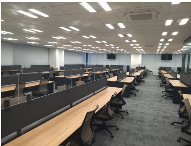
<オペレーションエリア>