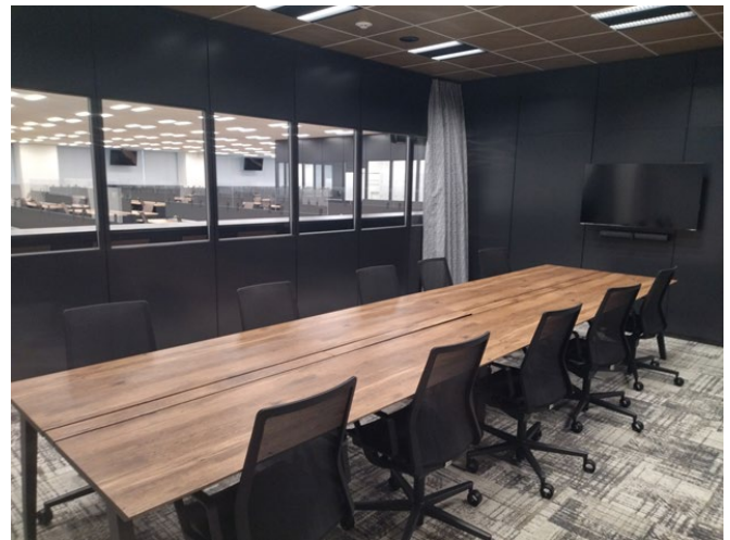
<カンファレンスルーム>