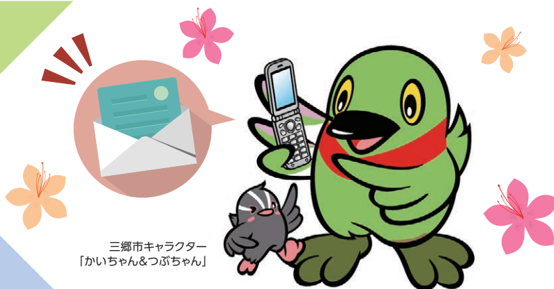
三郷市キャラクター 「かいちゃん&つぶちゃん」